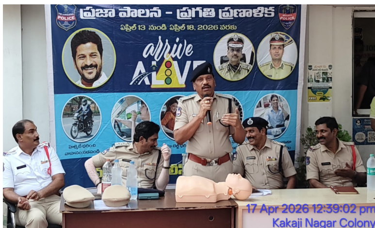
ఉమ్మడి వరంగల్ జిల్లా స్టాఫ్ రిపోర్టర్ ఏప్రిల్ 17 (ప్రజా వీక్షణం న్యూస్)

రోడ్డు ప్రమాదాల్లో ప్రమాదం జరిగిన గంట లోపు క్షత గాతులను హాస్పిటల్ కి తరలించి చికిత్స అందిస్తే క్షతగాతులు జీవించే అవకాశాలు అధికమని ట్రాఫిక్ అదనపు డీసీపీ తెలిపారు. ప్రజా పాలన ప్రగతి ప్రణాళికలో భాగంగా రాష్ట్రవ్యాప్తంగా నిర్వహిస్తున్న "అరైవ్ అల్టైమ్" రోడ్డు భద్రతా కార్యక్రమం 5వ రోజు సందర్భంగా శుక్రవారం రోడ్డు ప్రమాదాల నివారణ, అత్యవసర