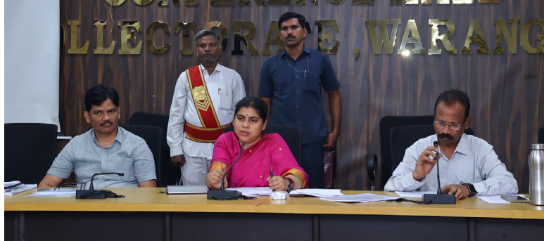
ఉమ్మడి వరంగల్ జిల్లా స్టాఫ్ లిపోర్టర్