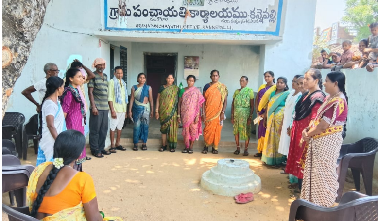
కొమరం భీం ఆసిఫాబాద్ జిల్లా ఏప్రిల్ 17 (ప్రజా వీక్షణం న్యూస్)

కుమ్మరం భీం ఆసిఫాబాద్ జిల్లా, కొటాల మండలం కన్నెపల్లి గ్రామం లో ఆరోగ్య విభాగం ఆధ్వర్యంలో పలు ఆరోగ్య కార్యక్రమాలు నిర్వహించ బడినాయి. గ్రామంలో గర్భిణీ మహిళల కోసం ప్రత్యేక వైద్య పరీక్షలు నిర్వహించడంతో పాటు కుమ్మ (లేప్రెస్)