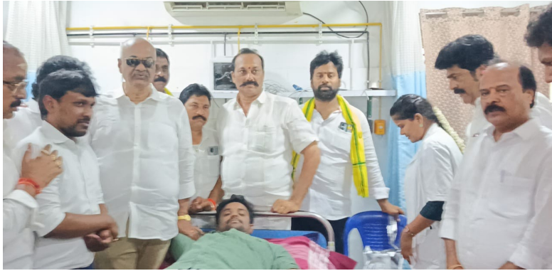
తాడేపల్లిగూడెం ప్రతినీధి ఏప్రిల్ 20 (ప్రజా వీక్షణం)