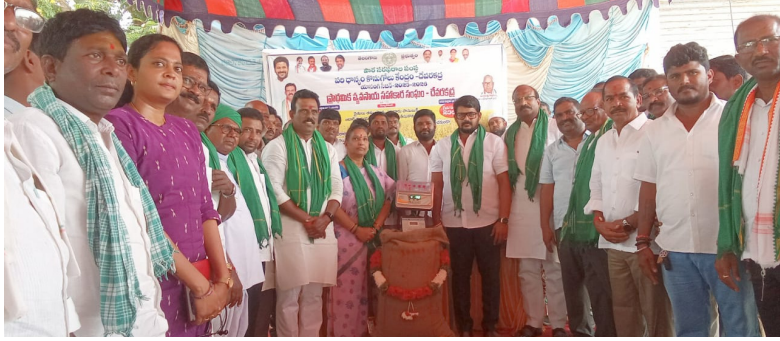
దేవరకర్ల ఏప్రిల్ 20 (ప్రజా వీక్షణం)

- వరి ధాన్యం కొనుగోలు కేంద్రాలను ప్రారంభించిన ఎమ్మెల్యే.