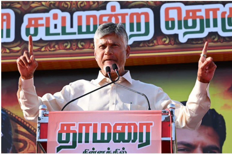
కోయంబత్తూరు, ఏప్రిల్ 20 (ప్రజా వీక్షణం)