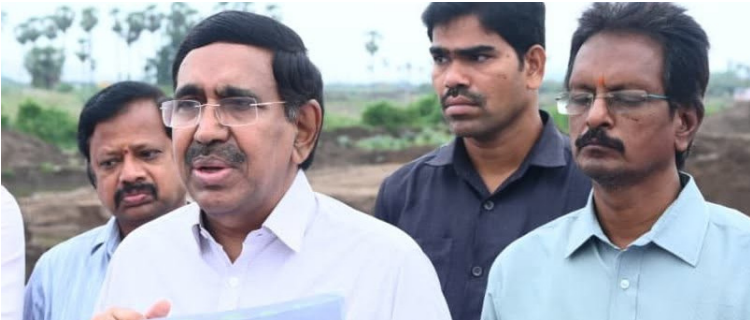
అమరావతి,జూన్ 13(ప్రజా వీక్షణం):

జగన్ విమర్శలను మరోమారు తిప్పికొట్టిన మంత్రి