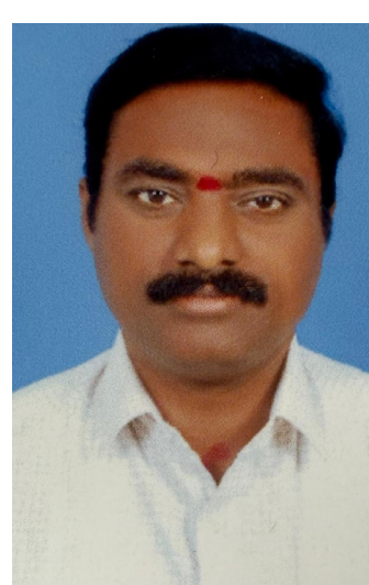
ప్రజా వీక్షణం ప్రతినిధి హత్తుకొండ